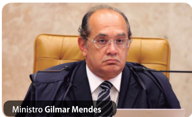
Ministro Gilmar Mendes

A regra era simples. Os direitos dos acordos coletivos possuíam vigor até a próxima negociação firmada. Afinal,