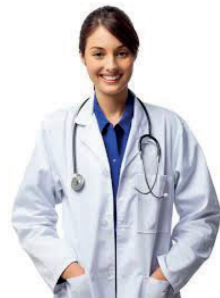
Imagem retirada da internet

ÀS CONSULTAS E EXAMES, A PARTIR DE ABRIL.