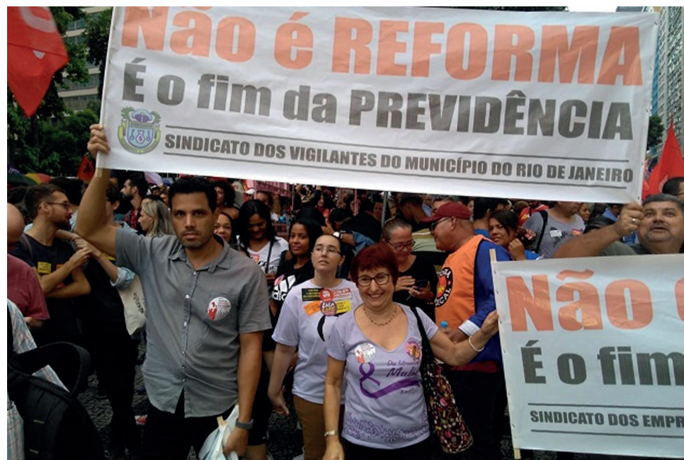
Diretoria presente no ato contra a Reforma da Previdência, dia 22/03/2019.

Novas manifestações serão marcadas em todo o país, é preciso que a Categoria de Vigilância Privada esteja nas ruas lutando contra a Reforma da Previdência. E você Vigilante, quando vai entender que essa reforma é contra você?